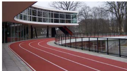
Im Herbst 2010, kurz nach Fertigstellung der Laufbahn.