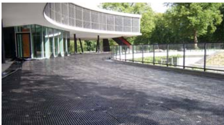
Kurz nach dem Verlegen der Elastodrain® EL 202 Platten als Unterbau für Laufbahn und Gehbelag.