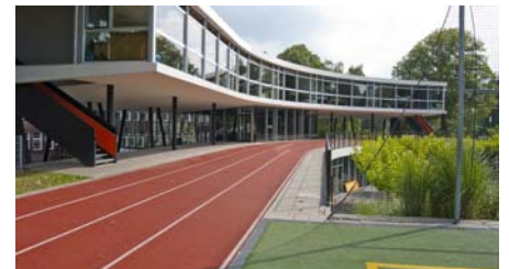
Der Übergang der Laufbahn vom gewachsenem Boden aufs Dach.