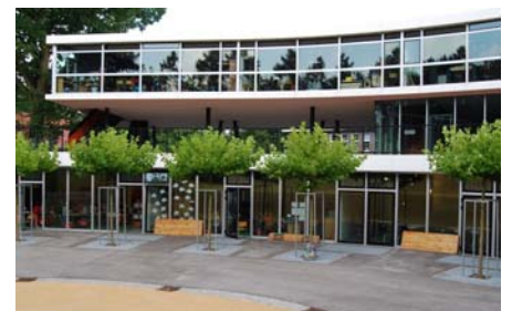
Über den Klassenräumen im Erdgeschoss befindet sich die Laufbahn, deshalb musste man besonders auf die Trittschalldämmung achten.