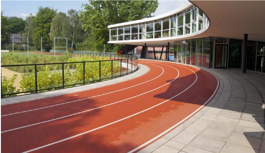
Die leuchtend rote Tartanbahn ist ein Markenzeichen des Neubaus der Gorch-Fock-Schule.