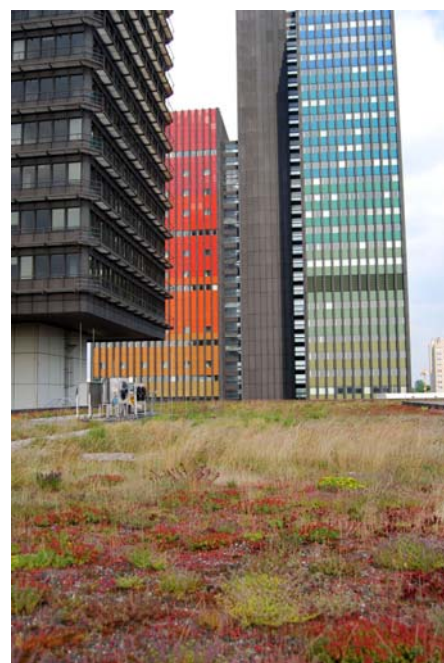
Die ehemaligen Rundfunkgebäude der Deutschen Welle sind im Hintergrund zu sehen. Das rote Gebäude war der Studioturm und das blaue der Büroturm.