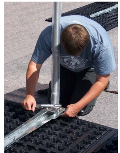
Auf den Geländerbasisplatten lassen sich auch individuelle Geländerlösungen montieren. Hier entschied man sich für eine Variante aus Edelstahl mit Glasausfachung. Die Geländerbasen werden montiert, ohne dabei die Dachhaut zu durchdringen. Gehalten wird das Ganze durch die Auflast des in Splitt verlegten Plattenbelags bzw. durch das Gewicht der Begrünung.