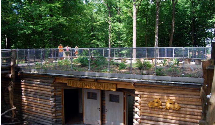
Die Besucherterrasse auf dem Info-Pavillon des neuen Wolfsgeheges.