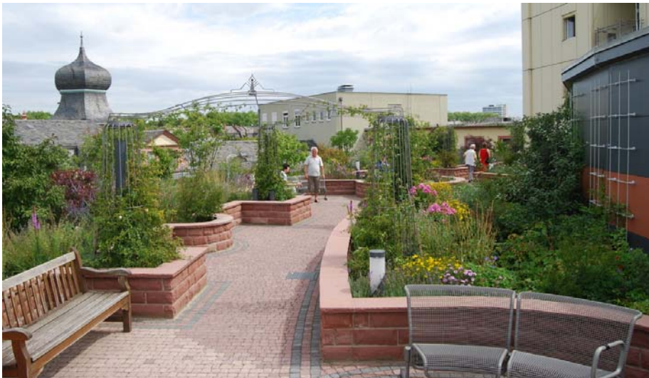
Der neue Dachgarten des Bürgerhospitals im Juli 2009.