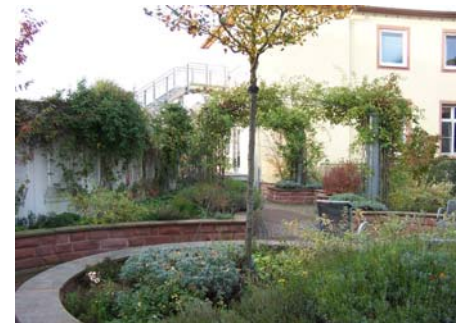
Der alte Dachgarten im Oktober 2006 (vor der Aufstockung des Gebäudes).