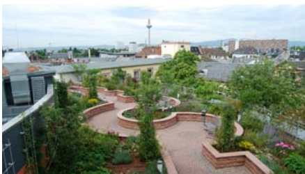
Der Dachgarten ein Jahr nach der „zweiten“ Fertigstellung (Juli 2009).