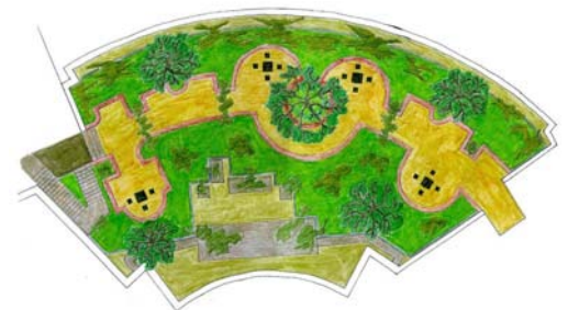
Diese Handskizze war Grundlage sowohl für den ersten als auch für den zweiten Dachgarten.