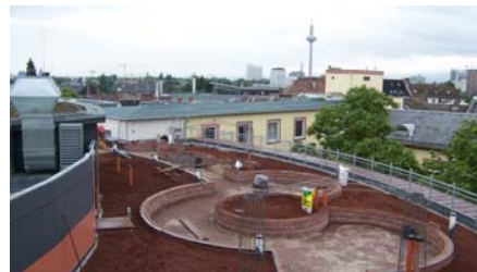
Die großen Pflanzbeete wurden mit der Systemerde „Dachgarten“ verfüllt.