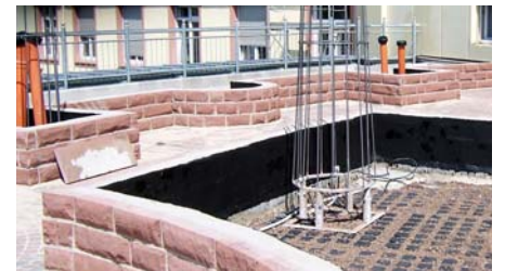
Sandsteinmauern trennen die Pflanzbeete von den Wegen ab.