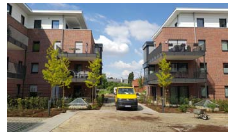
Nur anhand der Lichtkuppeln erkennt man, dass sich der Innenhof auf einer Tiefgarage befindet.