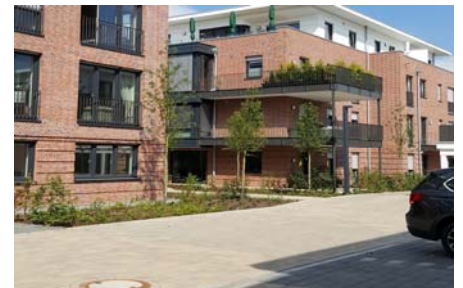
Die Geh- und Fahrbereiche wurden, wie auch die Pflanzbereiche, auf dem Dränelement Protectodrain® PD 250 realisiert.