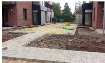
Ein Weg aus Pflastersteinen führt über die gesamte Tiefgarage.