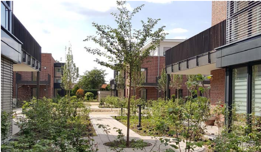
Die Gebäude sind um zwei quadratische Innenhöfe angeordnet, die als Spielplatz, grüner Ruheraum und auch als Freisitz dienen sollen.