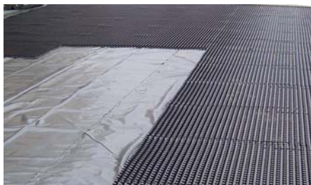
Zur gegenseitigen Fixierung wurden die PD 250-Platten nach der Verlegung miteinander verbunden.