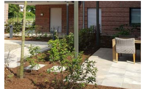
Alle Wohnungen verfügen entweder über einen Balkon oder eine Terrasse.