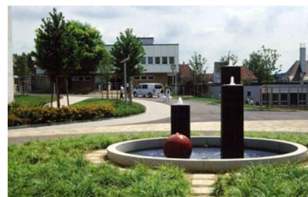
Pflanzbeet, Wasserspiel sowie Geh- und Fahrbeläge sind „unterkellert“.