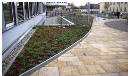
Auf der Substratoberfläche sind die Tröpfschläuche der Bewässerungsanlage zu erkennen.