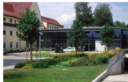
Vor dem Haupteingang des Krankenhauses entstand ein kleiner Park.