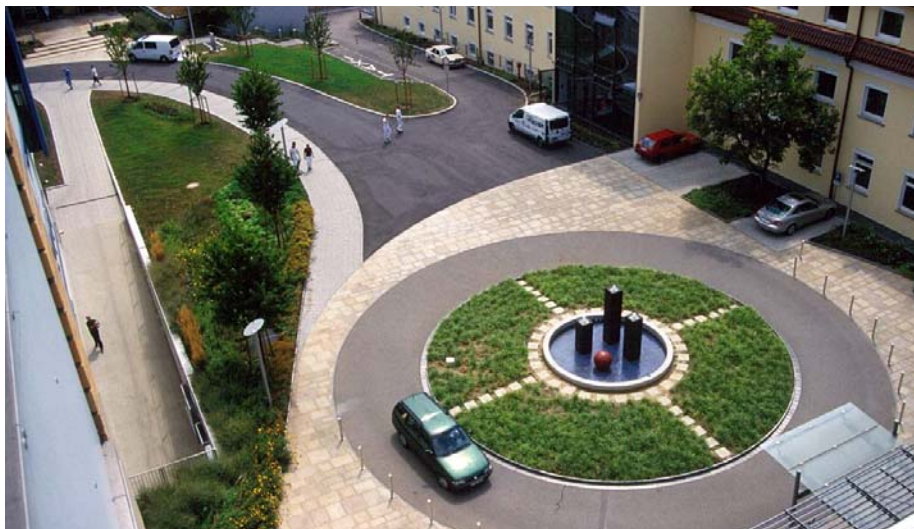
Die neugestaltete Zufahrt zum Städtischen Klinikum in Esslingen.