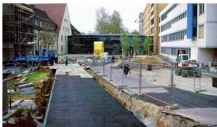
Verlegung von Elastodrain® EL 202 unter der späteren Krankenhaus-Zufahrt.