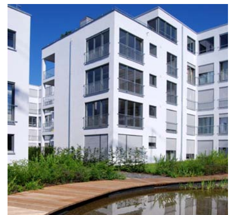
In diesen Teich mündet der künstlich angelegte Bachlauf.