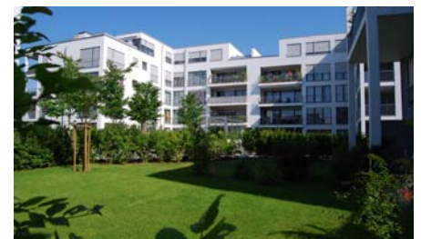
Noch sind die frisch gepflanzten Bäume relativ klein.