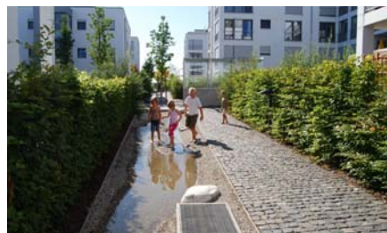
Auch der künstliche Wasserlauf wird gerne zum Spielen genutzt.