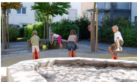
Ein Spielplatz mit Sandkasten ist Teil des „Blauen Gartens“.