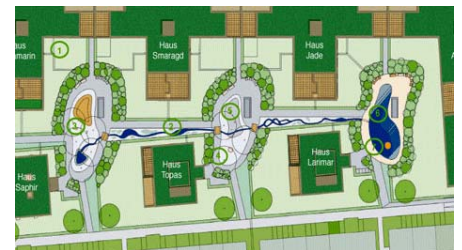
Der inzwischen umgesetzte Entwurf des Landschaftsarchitekten.

Der Scharnhäuser Park wurde insgesamt kinderfreundlich gestaltet; aus diesem Grund wurde auch im „Blauen Garten“ ein Spielplatz angelegt, sowie ein künstlicher Bachlauf, der in einen kleinen Teich mündet. Aufgrund der anspruchsvollen intensiven Begrünung entschied man sich für den Einbau von Floradrain® FD 60 Elementen, als bewährter Unterbau für Gestaltungsideen jeglicher Art.