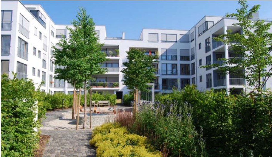
Teilansicht des „Blauen Gartens“ im Scharnhäuser Park in Ostfildern.