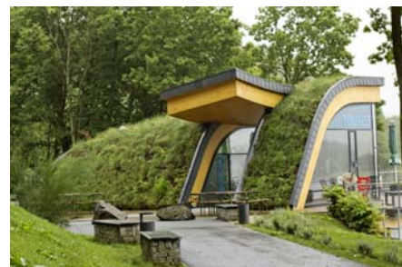
Die zwei Gebäude mit insgesamt rund 270 m 2 Dachbegrünung integrieren sich perfekt in die Landschaft.

Elemente eingesetzt. In den flacheren Bereichen hingegen wurden Floraset® FS 75-Elemente verlegt, die speziell für geneigte Dächer entwickelt wurden. Diese verhindern durch die großen, nach oben stehenden Noppen ein Abrutschen des Substrats. Als Begrünung wurden vorkultivierte Vegetationsmatten verlegt. Diese sorgen für Schutz vor Erosion und sofortiges Grün. Die umliegenden Flächen wurden parkartig gestaltet, mit Sitzbänken sowie einer neuen Treppe.