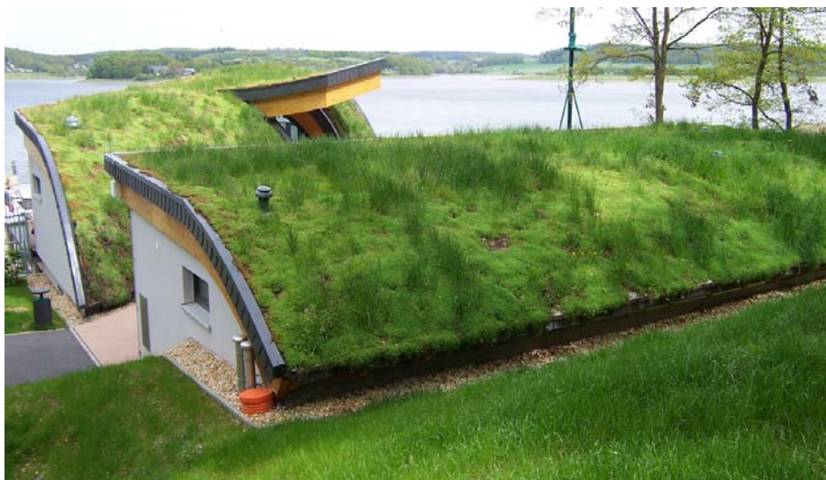
Die Schiffsanlegestelle an der Talsperre Pöhl mit Kassen- und Informationshäuschen und kleinem Bistro liegt direkt am Weg zwischen dem Campingplatz Gunzenberg und der Staumauer.