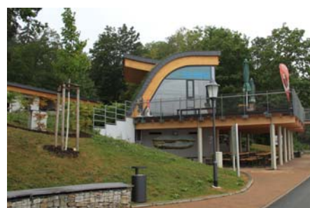
Die auskragende Terrasse bietet auch den Gästen der Fahrgastschiffe einen überdachten Wartebereich.