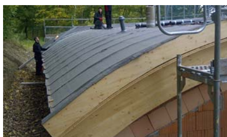
Nachdem das Dach wurzelfest abgedichtet war, wurden vor Aufbringen der Schichten des Gründach-Systemaufbaus ...