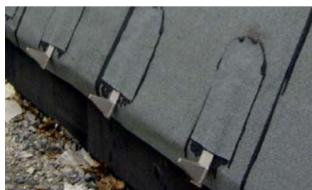
... an den unteren Dachrändern Traufschubhalter des Typs TSH 100 montiert und eingedichtet, welche zur Abtragung der Schubkräfte dienen.