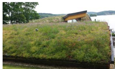
Beide Gebäude wurden mit vorkultivierten Vegetationsmatten begrünt.