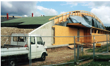
Das abgedichtete Dach vor Beginn der Begrünerarbeiten.