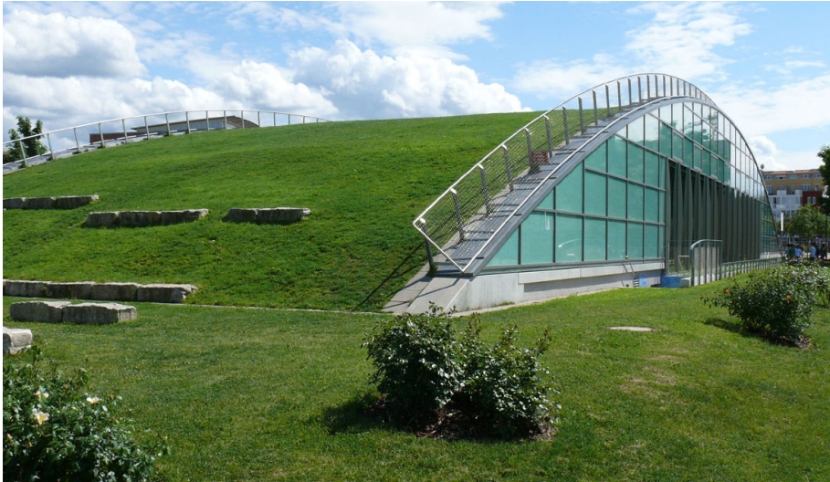
Das tonnenförmige, begehbare Sporthallendach der Clara-Grunwald-Schule in Freiburg-Rieselfeld.