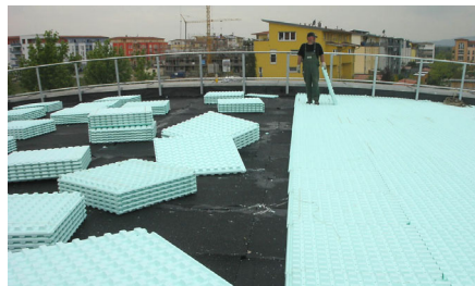
Verlegung der Floratherm® WD 65-H Elemente.