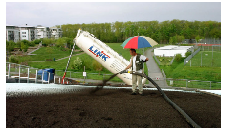
Das Substrat wird auf das Dach geblasen.