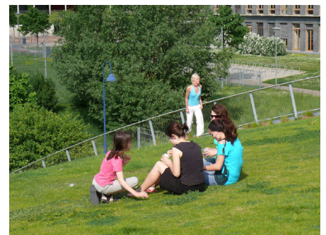
Das von beiden Seiten begehbare Dach wird im Sommer gern als Aufenthaltsfläche genutzt.