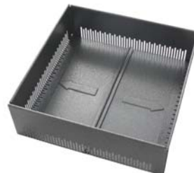
Transportzustand (Flansch eingeschoben)