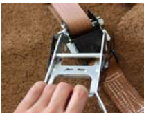
Ratschenhebel nach Spannen der Gurte abnehmbar

Speziell für Baumpflanzungen auf Gebäuden konzipiertes, durch Auflast gehaltenes und lastverteilendes Verankerungssystem für Wurzelballen.