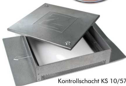
Kontrollschacht KS 10/57