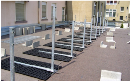
Einmessen und Auslegen der Geländerbasis GB, sowie ...