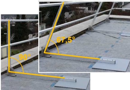
Aufstellwinkel 90° oder 67,5°

Durch Auflast gehaltenes Arbeitsschutzgeländer nach EN 13374 Klasse A für temporäre Arbeiten auf extensiv begrünten Flachdächern mit Attika.