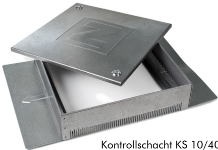
Kontrollschacht KS 10/40